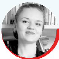
arch. Kucherova Anastasia STUDIO BOERI