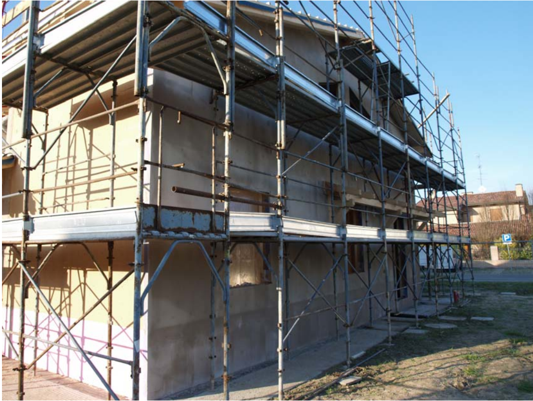
Viste esterne della prima rasatura sul cappotto