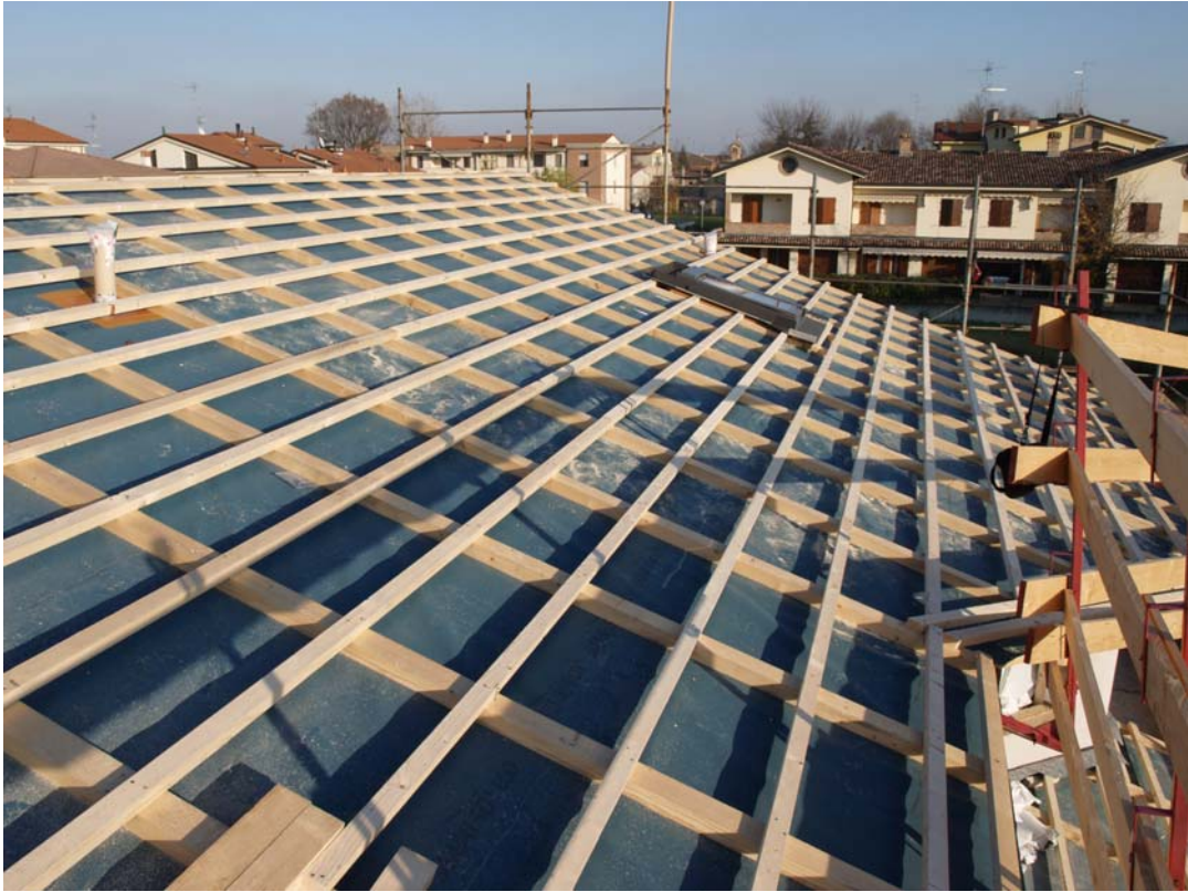
Listellara porta manto di copertura