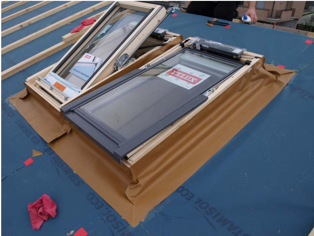
Particolari delle finestre a tetto con cornice a tenuta sul telaio