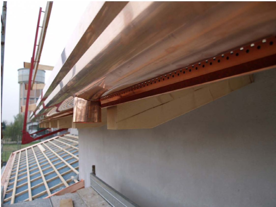
Particolare della griglia di ventilazione sottogrona