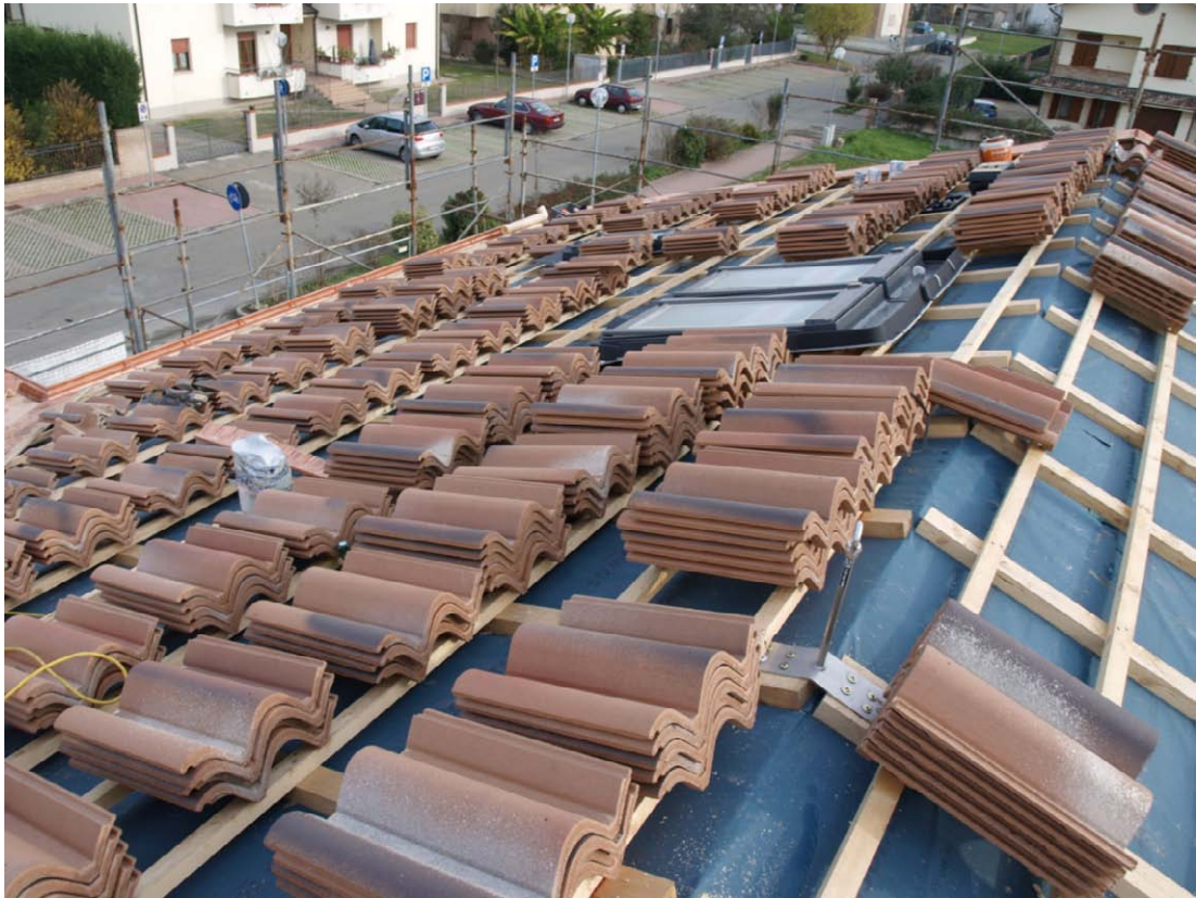
Inizio posa tegole, in primo piano predisposizione per linea vita