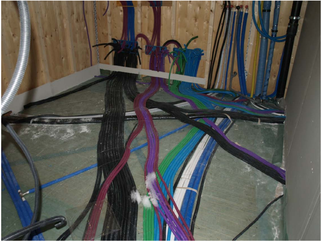
Posa degli impianti tecnologici