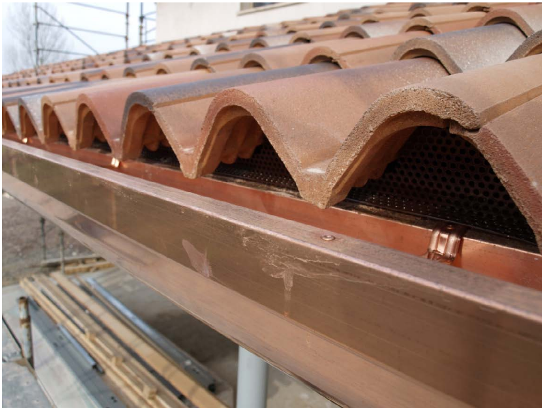
Particolare della griglia parapassero posata sotto la prima fila di tegole