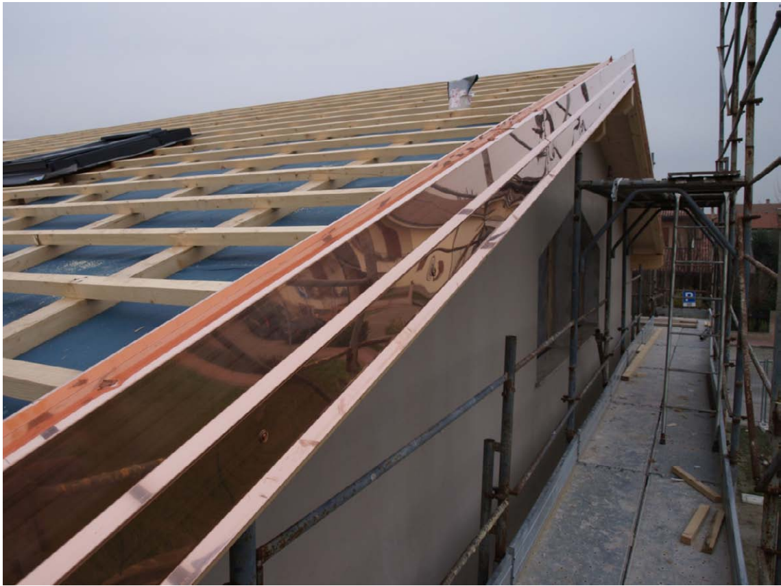
Posa della lattroneria in rame