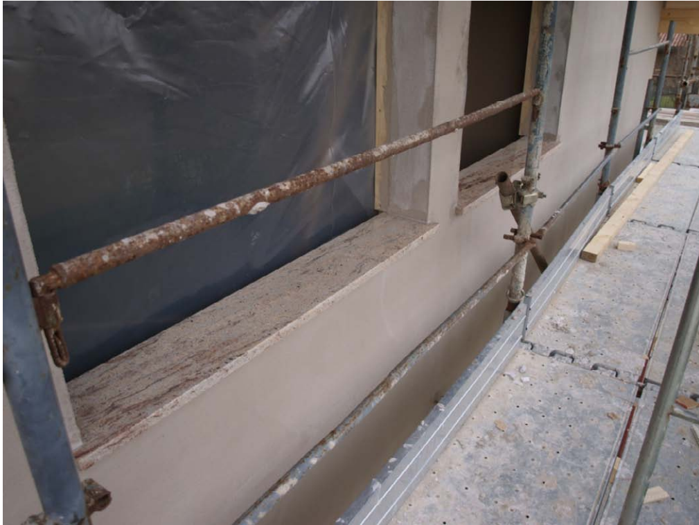
Posa bancali finestre