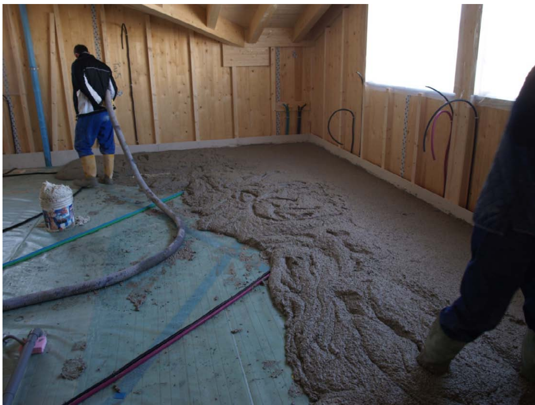
Posa sottofondo alleggerito a ricoprimento impianti